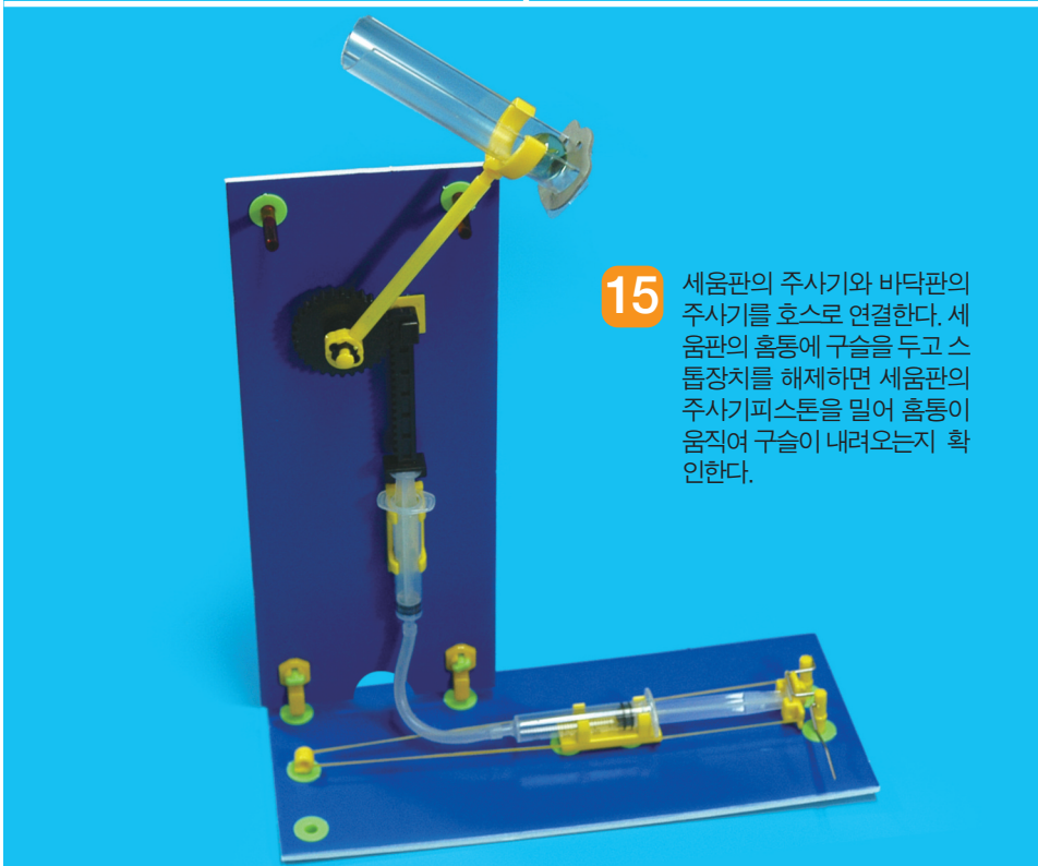
15 세움판의 주사기와 바닥판의 주사기를 호스로 연결한다. 세움판의 흡통에 구슬을 두고 스톱장치를 해제하면 세움판의 주사기피스톤을 밀어 흡통이 움직여 구슬이 내려오는지 확인한다.