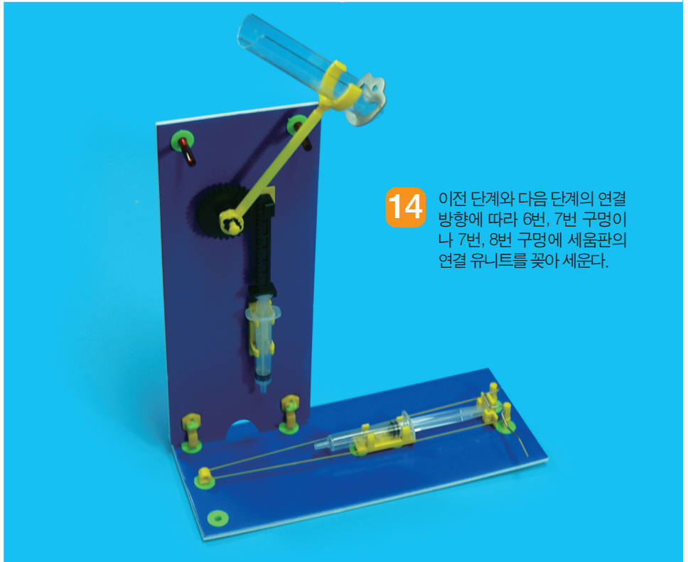
14 이전 단계와 다음 단계의 연결 방향에 따라 6번, 7번 구멍이나 7번, 8번 구멍에 세움판의 연결 유닛을 꽂아 세운다.