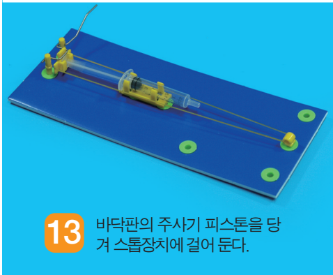
13 바닥판의 주사기 피스톤을 당겨 스톱장치에 걸어 둔다.