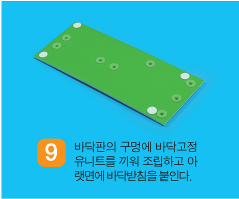
9 바닥판의 구멍에 바닥고정 유닛을 끼워 조립하고 아랫면에 바닥받침을 붙인다.