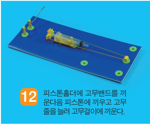
12 피스톤홀더에 고무밴드를 끼운다음 피스톤에 끼우고 고무줄을 눌러 고무걸이에 끼운다.